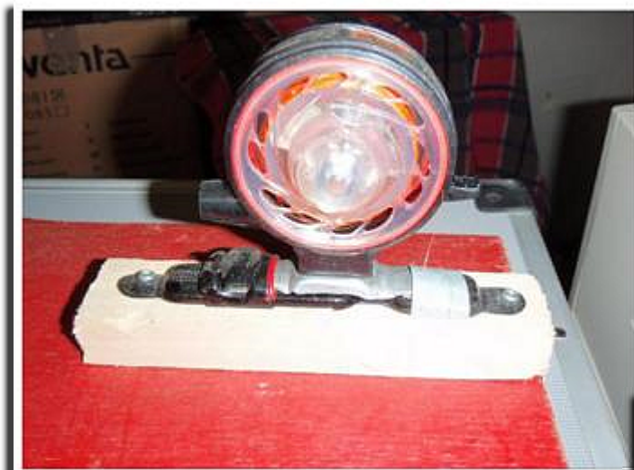
Détail du porte moulinet

Vu d'ensemble de mon bricolage pour bobiner le fil sur un moulinet, ici c'est un Ritma, mais ça peut-être n'importe quel moulinet.